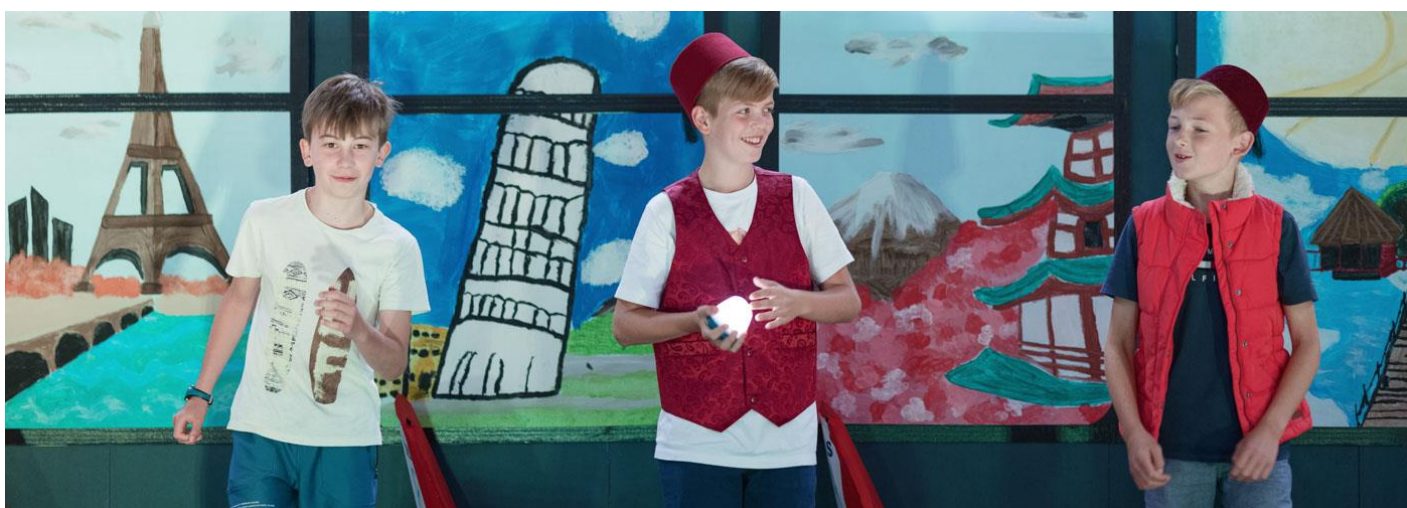
Musical groep 8 2022-2023

In alle gevallen blijft de groepsleerkracht verantwoordelijk.